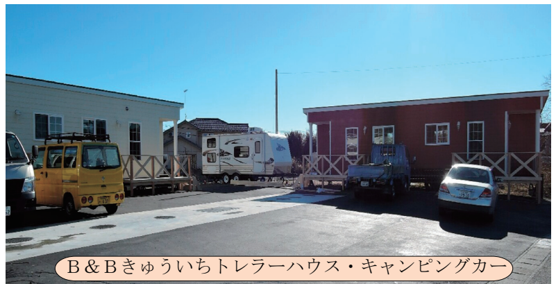
B & Bきゅういちトレーラーハウス・キャンピングカー