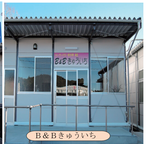
B & Bきゅういち