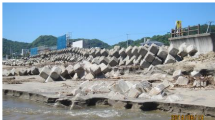
南側の海岸堤防工事箇所