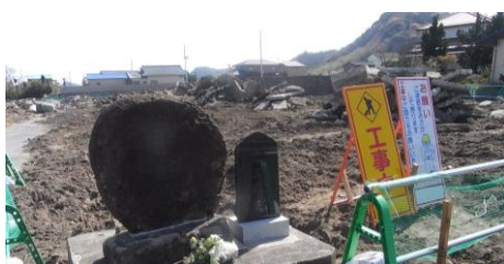
建物基礎の撤去工事が進む

◆工事が本格化し重機も多く入りますので、工事エリアの通行には十分にお気を付けてください。