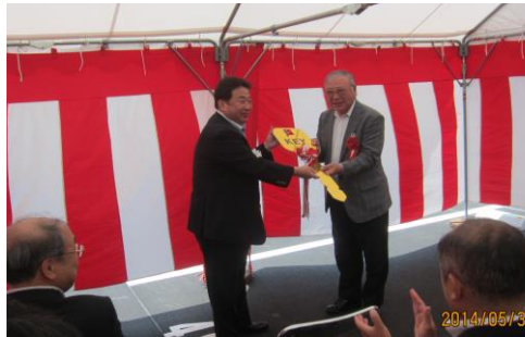
市長から鍵の引渡式(5月30日)