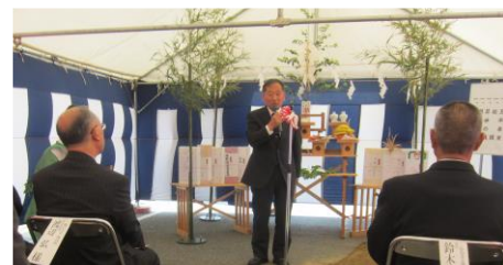
南側海岸堤防工事安全祈願式