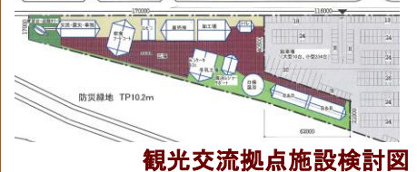
観光交流拠点施設検討図