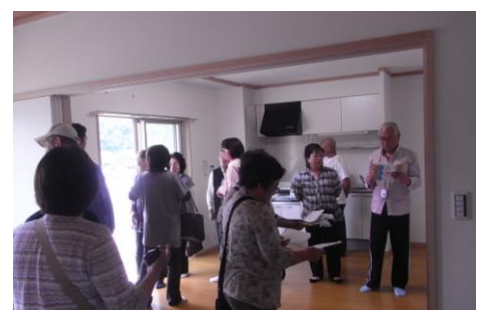
内覧会に訪れたみなさん(5月25日)

5月30日（金）午前10時に災害公営住宅豊間団地第6号棟の完成式と部屋の鍵の引渡式が現地で行われました。全戸完成は10月で、その日を待つ避難者がまだ多数いますが、震災から、3年と2カ月半・・・1日千秋の思いで待っていた災害公営住宅の完成に「復興の姿」がようやく現われ始めた思いがいたします。