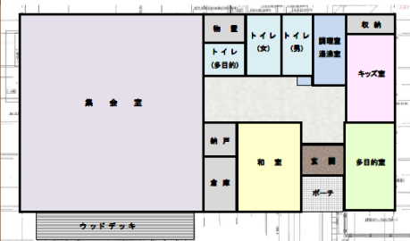
災害公営住宅集会所