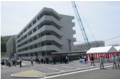
豊間団地6号棟と完成式会場